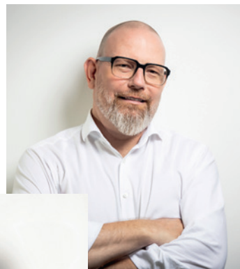
Herausgeber Robert Helbig

Wir möchten Sie einladen, einzutauchen in eine Sphäre, in der Stil, Handwerkskunst und Leidenschaft aufeinandertreffen. Hier erzählen Menschen von ihren automobilen Träumen, in denen eine Fahrt über Land zur Auszeit vom Alltag wird.